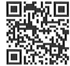
防災士養成研修実施一覧 (日本防災士機構HP)

県内では、加須市や行田市で防災士を要請する講座を開講するようです(2024年6月1日現在)。また、民間法人が県内で開催する講座もあるようです。