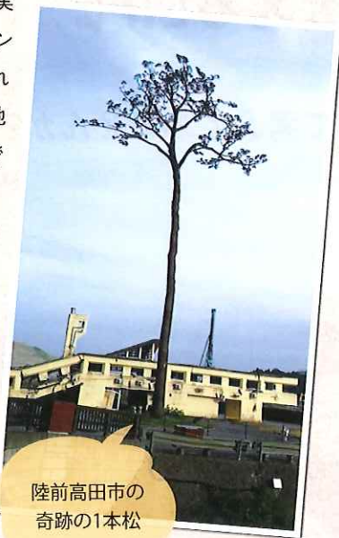
陸前高田市の奇跡の1本松

東北地方では、近所の人が集まってお茶することを「お茶っこ」という表現をするくらい、集まって話す時間は現地の人にとって大事な時間だったのかもしれない。そこから2年間は大学のプログラムとして定期的に陸前高田へ通っていました。