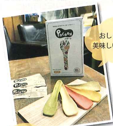
おしゃれで美味しい防災食

また応援し続けるという事はすごく大事なことだと思います。震災をきっかけに知った場所かもしれませんが、その地域と良い関係が長く続くとお互いにとって良い循環が生まれそうですね。