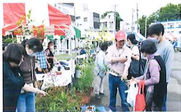
2023年のコミュニティひろば会場

NPOくまがや (指定管理施設・市民活動支援センター) TEL:048-522-1592 メール:npokumagaya@gmail.com 熊谷市曙町5-67