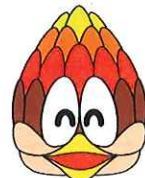
本校マスコット キャラクター 「ぼっくりん」

特別支援学校および障がいのある子どもたちへの理解を深め、学校行事や日常の学校生活での「学校支援ボランティア」を養成する講座です。障がいのある子どもたちの学習を支えてくださる方を募集します。たくさんのご応募お待ちしております!