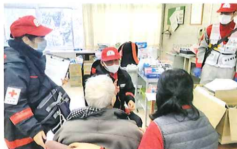
避難所の小学校で診療する小川赤十字病院救護班

埼玉県支部からも、さいたま赤十字病院・小川赤十字病院・深谷赤十字病院の「救護班」が被災地にかけつけました。また、全国の赤十字ボランティアの皆さんも、現地で救護のための資材・器材の撤収作業を行ったといえます。