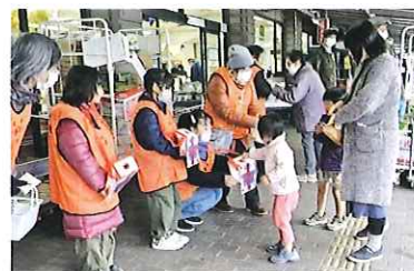
災害義援金募金活動のようす(深谷市赤十字奉仕団)