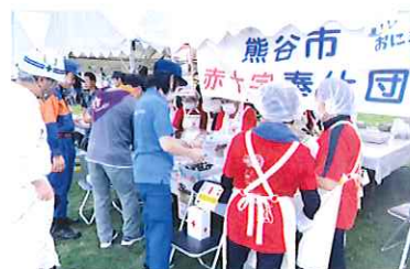
炊き出し訓練のようす(熊谷市赤十字奉仕団)

また、深谷市赤十字奉仕団は、日頃からの炊き出し訓練の他、災害発生時には、道の駅や商業施設で災害義援金募金活動を行い、自分たちにできる支援を行っています。