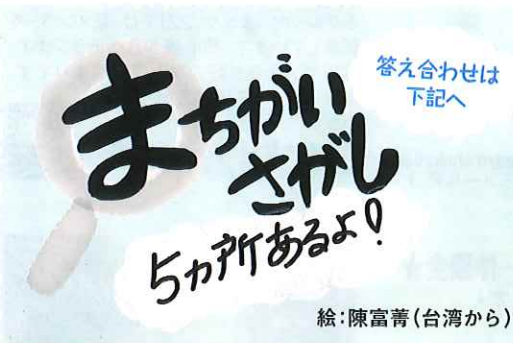
絵:陳富菁(台湾から)