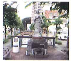
「戦災者慰霊の女神像」

星溪園「玉の池」よりわき出る清流を源とし、染物を洗ったり、水遊びをしたといえます。現在は表流と地下水路(農業用水)で立体化した河川として整備されている。熊谷市は、昭和20年8月14日に米軍の空襲を受けて、星川でも多くの犠牲者がありました。