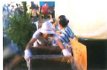
コロナ前年2019年の活動

NPOくまがや TEL:048-522-1592(市民活動支援センター) メール:npokumagaya@gmail.com