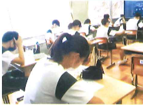
熱中症対策:ひと涼みアワード2022 行政部門 トップランナー賞 受賞

本校は、熱中症予防啓発活動に取り組んで7年目となりました。昨年度は、保健委員の3年生が作成した熱中症対策のポイントをまとめた熱中症対策検定を実施し、全校生徒の95.9%が合格しました。また、熱中症対策をまとめたカードを地域の公民館や老人福祉施設に配付する等の啓発活動も行いました。これら取組が「ひと涼みアワード2022(後援:環境省)」において評価され、「行政部門トップランナー賞(熱中症対策に取り組む団体の日本一)」に選出されました。