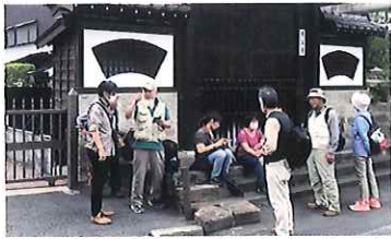
4月に行われた関東大震災のフィールドワーク。9月30日にも予定

NPOくまがや TEL:048-522-1592(市民活動支援センター) メール:npokumagaya@gmail.com