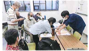
防災支援研究会と立正大生が連携した11月の「歩いて知る!防災まち歩き」

お問い合わせ先 NPOくまがや TEL:048-522-1592(市民活動支援センター) メール:npokumagaya@gmail.com