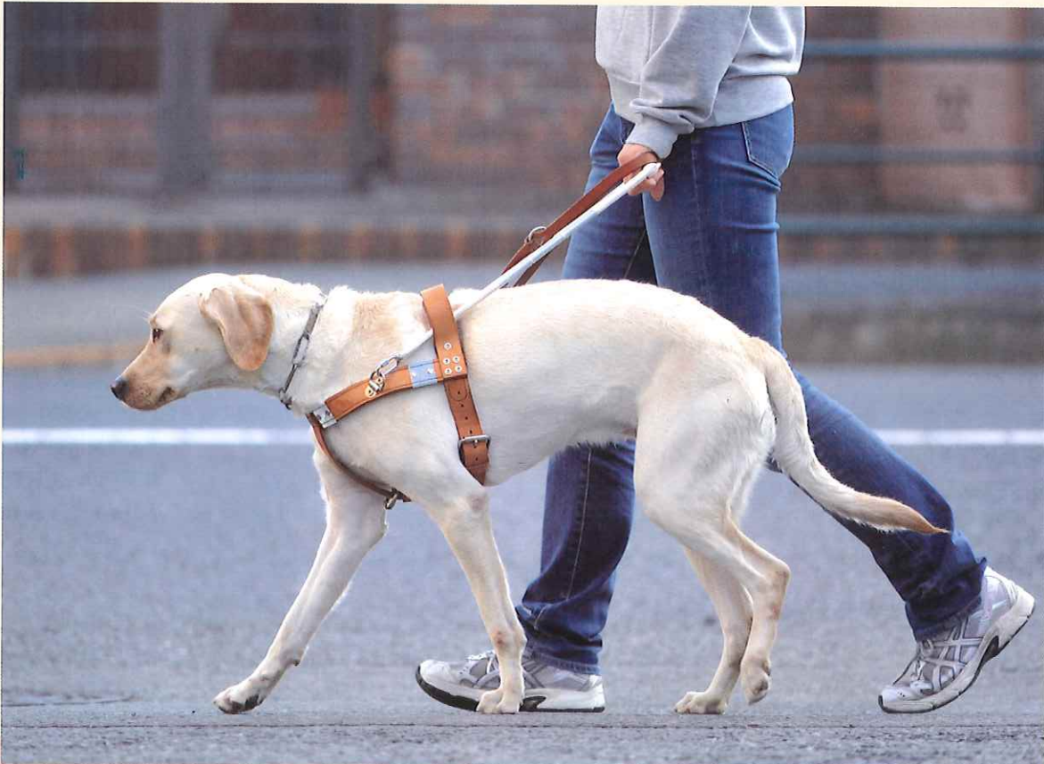
アイメイト(盲導犬)との歩行の様子