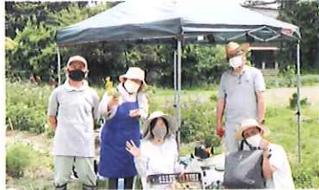
奈良・くまかんれんのじゃがいも収穫

お申込み・お問い合わせ先 熊谷市市民活動支援センター TEL:048-522-1592 メール:sc@npokumagaya.org