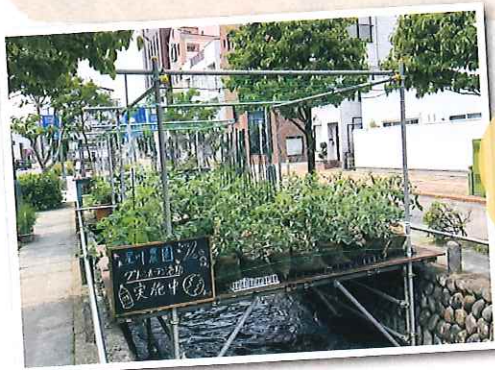
麻袋の鉢で サステナブルな グリーンカーテン

暑さ日本一になったことのある5都市で、暑さ×まちづくりの活動をしています。取り組みの軸は「地域資源を活用する」です。例えば山形は1933年から74年間も日本一暑かったので、冷やしジャンプや冷やしラーメンといった「冷やし」文化が地域として根付いています。それを山形大学の学生と発信することで新しい冷やしの文化を作り、地域に明るい話題を生み出しています。地元熊谷では、中心市街地を流れる星川を地域資源と捉え活用しています。事業の1つ空中スイカでは、川沿いの商店街と連携をして歩く人が楽しめてかつ涼しめるようにグリーンカーテンとしてスイカを植えています。星川の川床では、キュウリとミニトマトを植えて、空に浮かぶ空中キュウリと空中トマトを実施しています。今年の夏は星川沿いにマンションも増えたことを活かして、子供達と収穫体験ができないかと企んでいます。毎年、熊谷では5都市が取り組みを発信しあう「アツいまちサミット」を5月に開催しています。