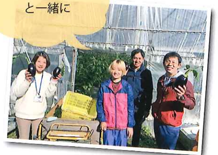
米ナス農家さんと一緒に

これまで暑さ日本一は山形市でした。しかし、2007年に熊谷、多治見(岐阜県)が最高気温を更新しました。その時、盆踊り大会などを企画している地元のまちづくり団体「元町子供会」でご飯を食べて、「最高気温を同日に更新した、多治見となにかできないか!」という話になりました。その場のノリで「多治見まちづくり株式会社」に通メールを送りました。しばらく音沙汰がなかったのですが、6か月後くらいに「すみません!迷惑メールに入っていました!今度浦和に行くので一回会いますか。」と返信が来て、そこから歯車が回り始めました。その後、夏場にFacebookで「今日の熊谷と多治見の暑さ対決」を発信する様になり、また、暑さ地域のPRも始めました。このように最初は思いつきだったものが、徐々に大きくなっていき、今では全国で年間100本を超えるメディアに取り上げて頂き、大手企業と連携をしたまちづくりを実現できるようになりました。