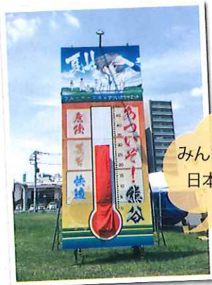
みんなで作った 日本一の温度計