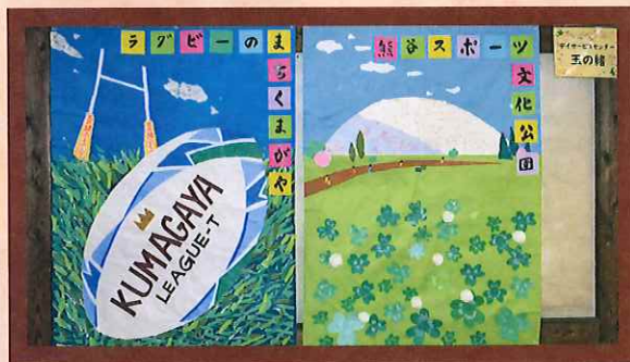
第155回 シャングリラ