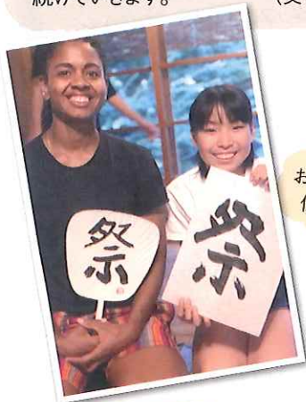
お祭りの楽しさを 伝えられたよ!

人生は、時にはトントン拍子にはいかないこともあります。その中で自分で考えて問題を解決していく力があれば、幸せな生き方ができるようになっていくのではないのでしょうか。ボランティアを通してそのことをより多くの方が体感できるように、これからも活動を続けていきます。 (文：森田大樹)