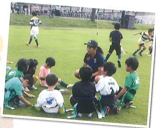
実際にARUKASの選手に子どもたちが教えてもらって興味津々