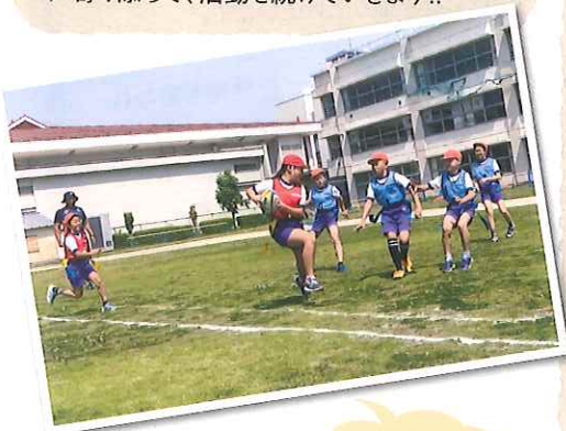
小学校で実際にタグラグビー!

自分が興味を持てるもの、好奇心を持てるものが見つかるように、色々なことを経験して欲しいです。世の中やってみないとわからないことだらけです。失敗しても良いんです。挑戦してみてください。そうやって自分が情熱を傾けられるものを見つけられることが、一番幸せなことじゃないかな、と思います。ラグビーじゃなくてもいい、なんでもいいからやってみてください。その中で、もしラグビーに挑戦したい、触れてみたいと思った時は、いつでもアルカスのことを思い出してください。私たちはこれからも熊谷の皆さんに寄り添って、活動を続けていきます!!