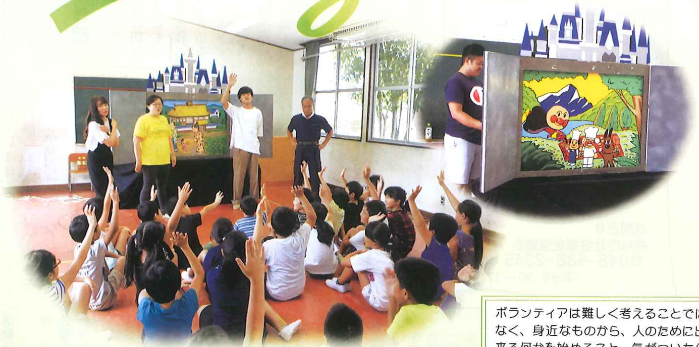
ジャンボ紙芝居公演 児童クラブ訪問

ボランティアは難しく考えることではなく、身近なものから、人のために出来る何かを始めること。気がついたら「それってボランティアじゃない」と他人に言われて、自分の成長を発見し、喜びを見つける。 そんなボランティアのお手伝いしてます。