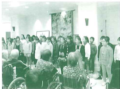
ルーエ訪問時の写真

本校は、学校教育目標「自ら学ぶ子 心豊かな子 進んで鍛える子」を「熊谷南小学校合言葉17の取組」として具体化し、知・徳・体のバランスのとれた教育を推進しています。豊かな心や奉仕の心を日常の生活の中にならすことのできる児童に、異なる年齢集団での活動を行っていきます。以下に、これまで、本校が取り組んできた実践を紹介します。 ○VS活動(ボランティアサーブス) 毎月第一火曜日の業間休みにはVS活動として、たてわり班で校庭の除草や教室の清掃を行い、学校や地域を清掃し、勤労・奉仕の意識を高めることができました。 ○交流活動Ⅱ「福祉の心を育む交流事業」として、4年生が特別養護老人ホームルーエを訪問しました。合唱を披露したり、手紙を渡したりして、施設利用者と交流を深めることができました。また、1年生の生活