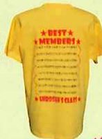
人気のシルクプリント！