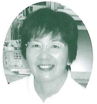
鴻巣市社会福祉協議会 ボランティアコーディネーター