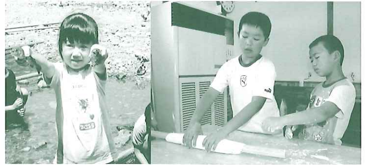
マス2匹つかまえたぞ〜。 ウメエ〜うどん、打ってやるからな!!