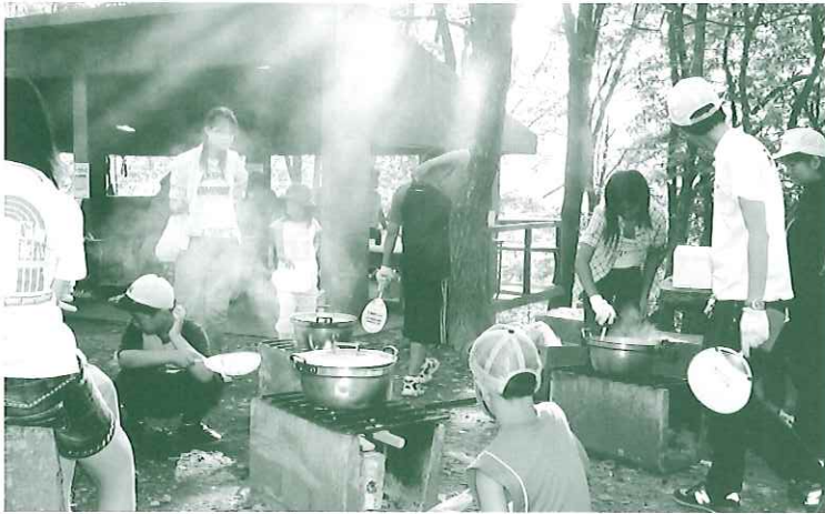
こもれびの下で薪炊飯「気分サイコウ!!」

8月3日〜5日の3日間、埼玉県青少年総合野外活動センターにて第12回サマーキャンプが行われ、総勢46名の参加があった。キャンプ中は天候に恵まれ、楽しくも有意義なひと時が過ごせた。初日テントサイトに到着。20名程は泊まれるビッグなテントに荷物を置き、早速今晚の夕食作りにとりかかる。メニューはカレーライス。普段「お腹が空いた」と言えば目の前に食事が出てくる生活とはちよつと違う。