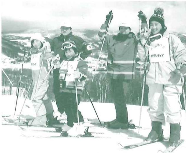
菅平頂上征服やったあ〜。

こもれびの会主催のスキー教室が三月十二日から一泊二日の日程で行なわれた。このスキー教室は、青少年育成を目的とした社会教育の一環として、楽しくスキーを覚えることはもとより、親元を離れた生活の中で、上下関係に気づいたり、規律や約束を守る生活体験を通じて快い挨拶のできる子どもたちの育成をねらいとした企画である。今回は、総勢三十五名が集い、一泊二日と短いながらもスキーを通していろいろなふれあいに有意義な時間を過ごすことができた。