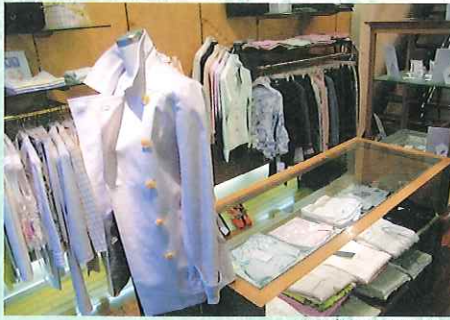
どうぞお気軽に店内へ

シンプルなお中にもちょっぴりかわいらしさやエレガンスをアクセントにしたアイテム展開。着回しのきくものも多く、様々なシーンで役立ちます。バッグや靴、アクセサリも揃うので、トータルコーディネートもOK。