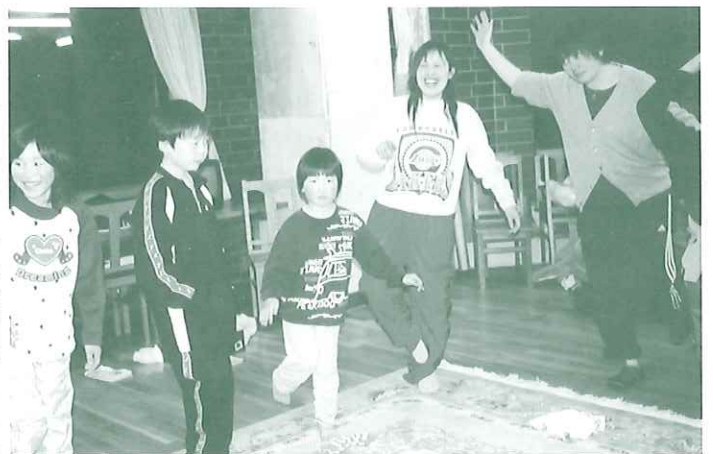
夜レクも楽しいんだぞ〜。

目をはずした子どもも叱ったり。いろいろなふれあいの中で多くのことを学んだ。これからも、スキー教室を通して子ども達に集団生活での協調性や友達に対する思いやり、