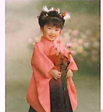
写真2ポーズ付き、男子着付け付き 女子ヘアメイク着付け付き