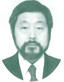
〈変わる〉ボランティア