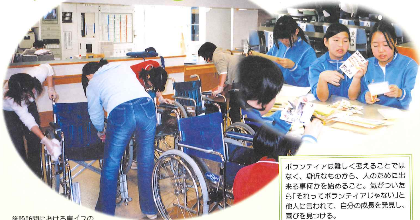
施設訪問における車イスの 掃除をするボランティアたち

ボランティアは難しく考えることではなく、身近なものから、人のために出来る事何かを始めること。気がついたら「それってボランティアじゃない」と他人に言われて、自分の成長を発見し、喜びを見つける。 そんなボランティアのお手伝いしてます。