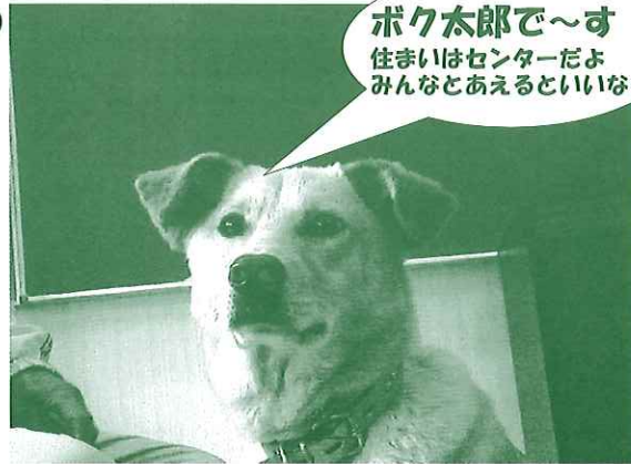
ボク太郎で～す 住まいはセンターだよ みんなとあえるといいな～