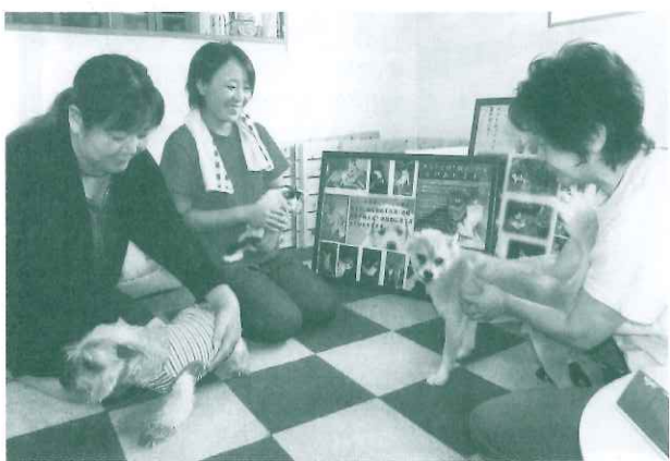
平成27年9月22日 埼玉新聞社様掲載

尚、動物の引き取りは行っておりません。里親募集、イベント開催、フリーマーケット出店などの詳細については、ブログをご覧ください。 http://cocoorange.blog.fc2.com/