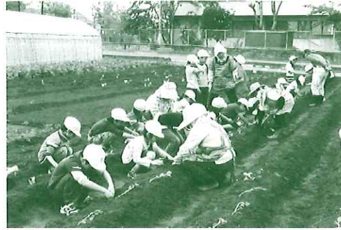
地域の方とサツマイモの苗植え

招待して「とれたぞ集会」を行います。学校農園でとれた野菜の収穫祭です。地域の方と一緒に遊んだり肩もみやお茶を出して触れ合うことで、交流が深まり、特にお年寄りには喜ばれています。各教科でも福祉を意識した学習を行い、特に三、四年生の総合的な学習の時間に「手をかそう、みんな親切！男沼っ子」のテーマで高齢者疑似体験や点字や手話の体験を行っています。 学校内でのほんの小さな親切、ボランティア活動が子どもたちの笑顔とともに地域へ発信されることを願い、全職員一丸となって推進しています。