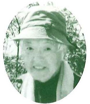
桜木っ子ふれあいじゅく