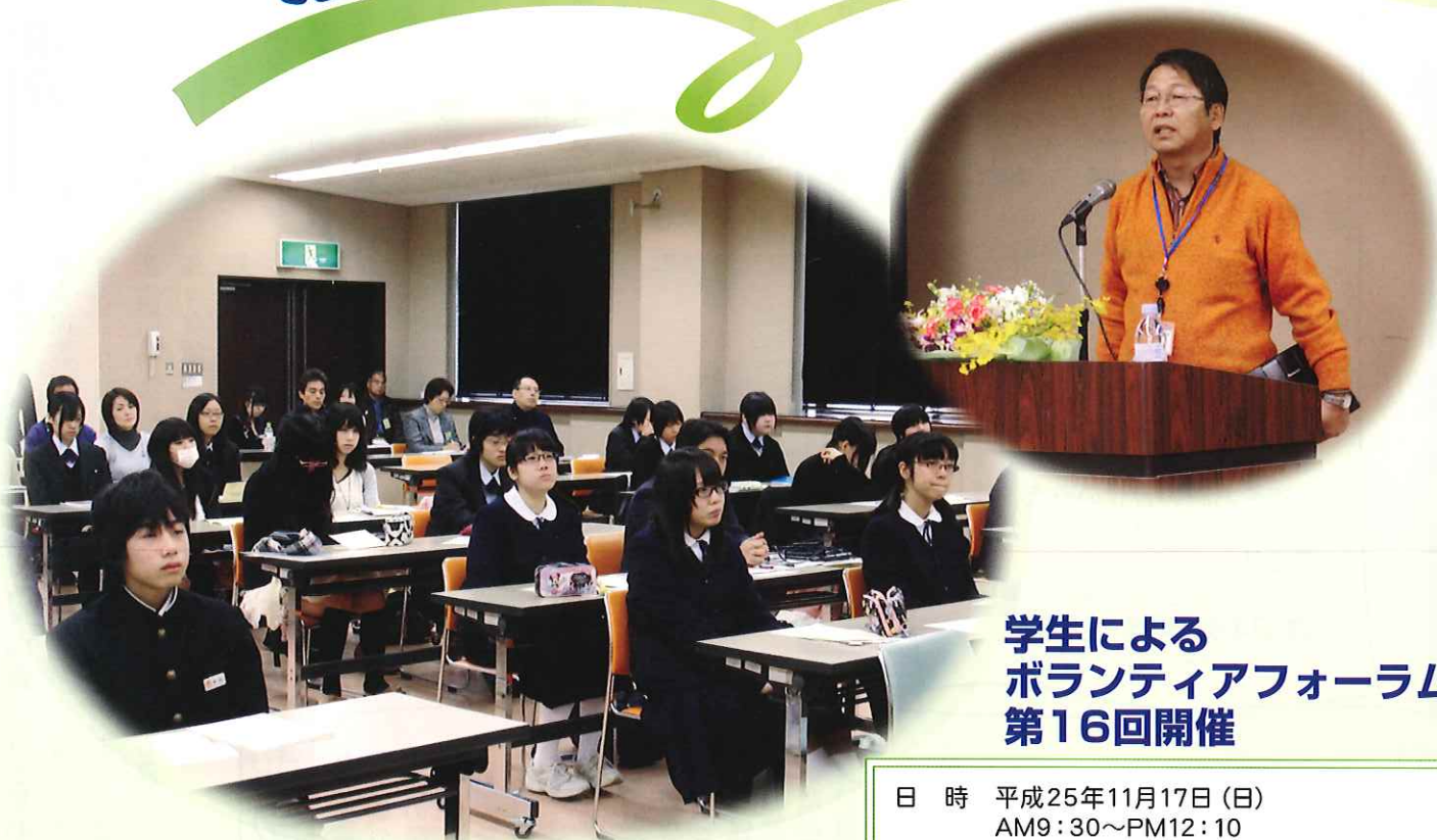
第14回 ボランティア フォーラム写真